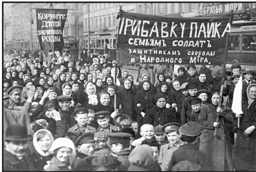
Trabajadoras marchaban en 1917 por San Petersburgo exigiendo al gobierno alimentos para sus hijos que estaban en la guerra