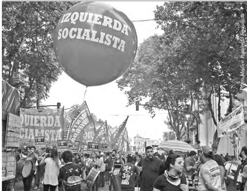
Izquierda Socialista en la última marcha reclamando justicia por Maldonado