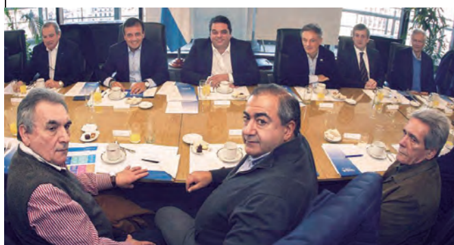
El triunvirato de la CGT entregando conquistas de los trabajadores