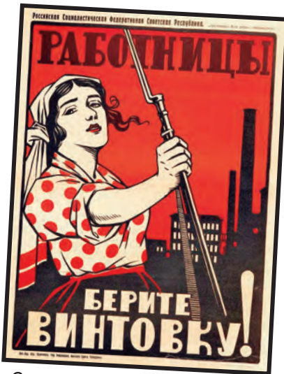
Cartel de propaganda política. "Mujeres trabajadoras retoman los fusiles contra los blancos enemigos".

Sin embargo, a cien años de esta gran revolución, mientras en el mundo seguimos luchando contra la opresión patriarcal y la explotación capitalista, por el derecho al aborto, la igualdad laboral y contra la violencia machista, no nos olvidamos de las enseñanzas de las feministas revolucionarias de esta primera época. Como señalaba Inessa Armand, no debemos olvidar que "si la liberación de la mujer es impensable sin el comunismo, el comunismo es también impensable sin la liberación de la mujer".