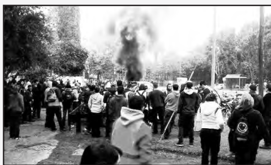
Protesta de los despidos de Tecnosport Nike

Los trabajadores de Tecnosport Nike se encuentran realizando una huelga en reclamo de la reincorporación de los despidos, el pago de horas descontadas y el cese del maltrato y abuso laboral por parte de los supervisores. La medida de fuerza se inició el 2 del corriente en la planta del parque industrial de Villa Flandria, Luján.