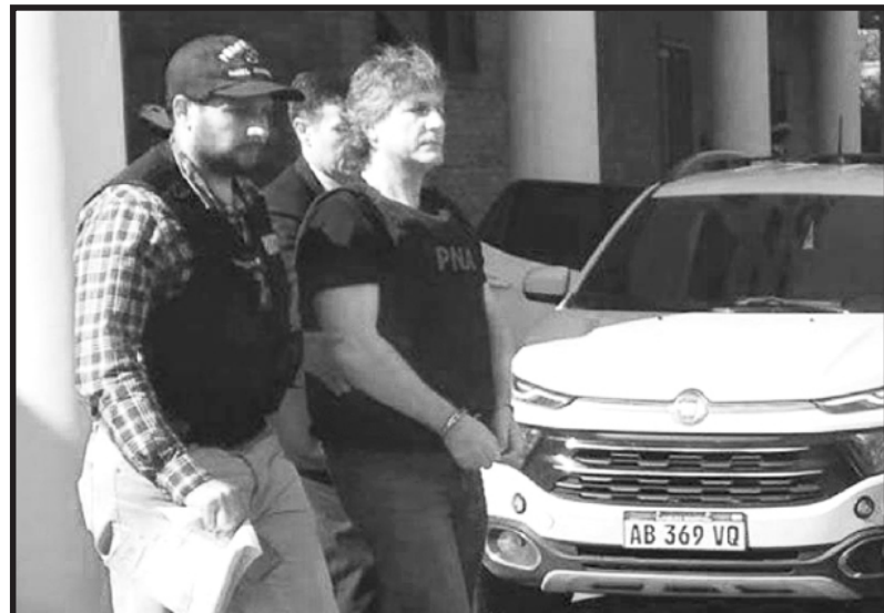
Después de cajonear la causa, el juez Lijo detuvo a Boudou