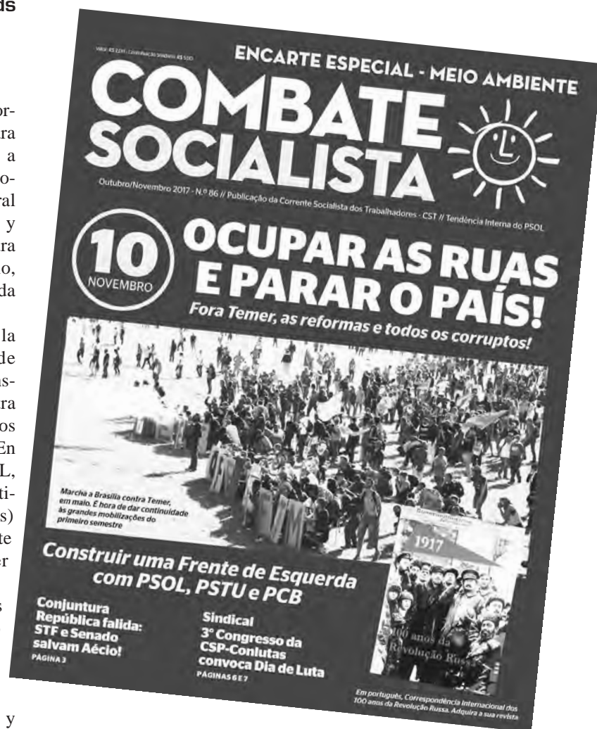
Tapa del periódico de nuestra organización hermana de Brasil, la Corriente Socialista de los Trabajadores (CST)

Aunque las centrales más grandes no convocan al paro general, esta jornada de luchas y paros tendrá importante repercusión y será un paso fundamental para presionar desde las bases y continuar la movilización con nuevos paros generales en apoyo a los que luchan.