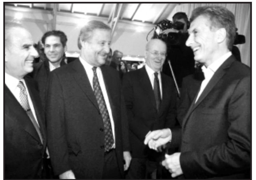
Macri y las patronales lanzaron un violento plan contra los trabajadores

plantear una alternativa política de verdad, como lo hacemos desde Izquierda Socialista y el Frente de Izquierda, con un auténtico programa