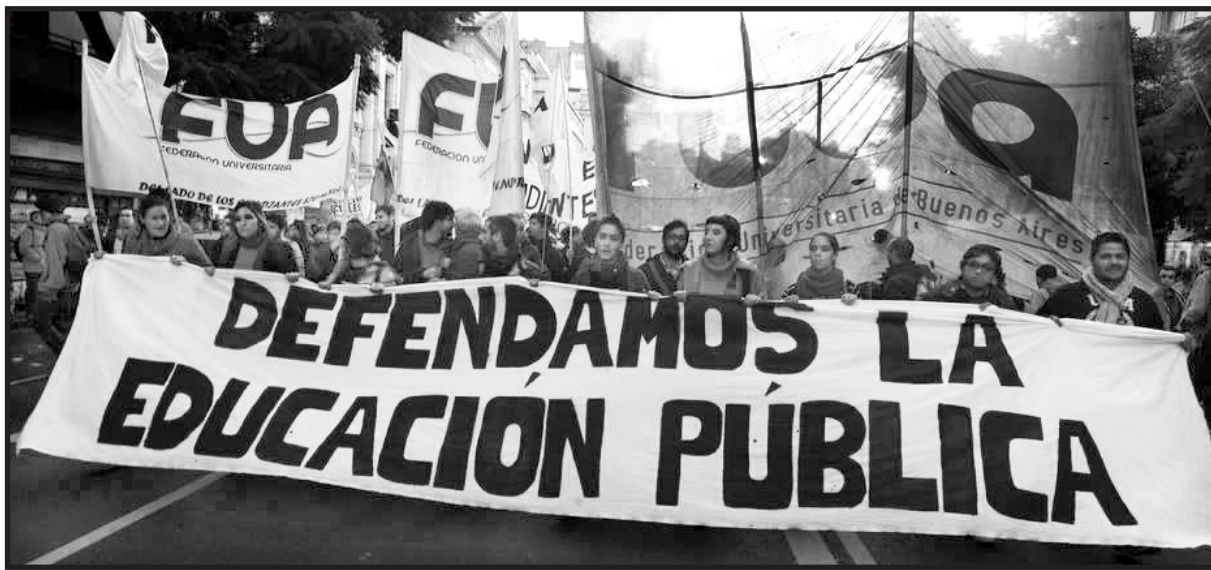
Ante el nuevo ajuste, el movimiento estudiantil tendrá que volver a salir a la calle