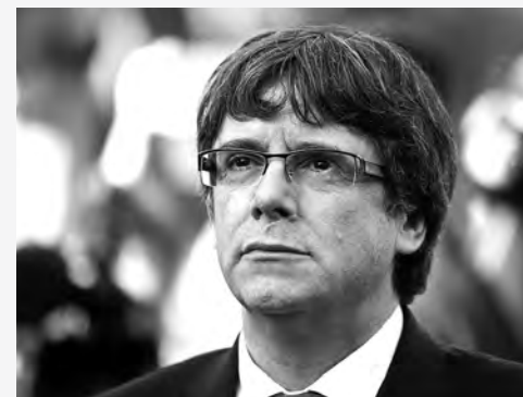
Carles Puigdemont huyó y se entregó en Bélgica

Por su parte, los grandes capitalistas catalanes mudaron la sede de 1.500 de las mayores empresas fuera de Cataluña. Y los poderes capitalistas internacionales, comenzando por Donald Trump y la Unión Europea, se pronunciaron casi unánimemente por "la unidad de España", es decir contra la República de Cataluña. Evidentemente esto y la presión de