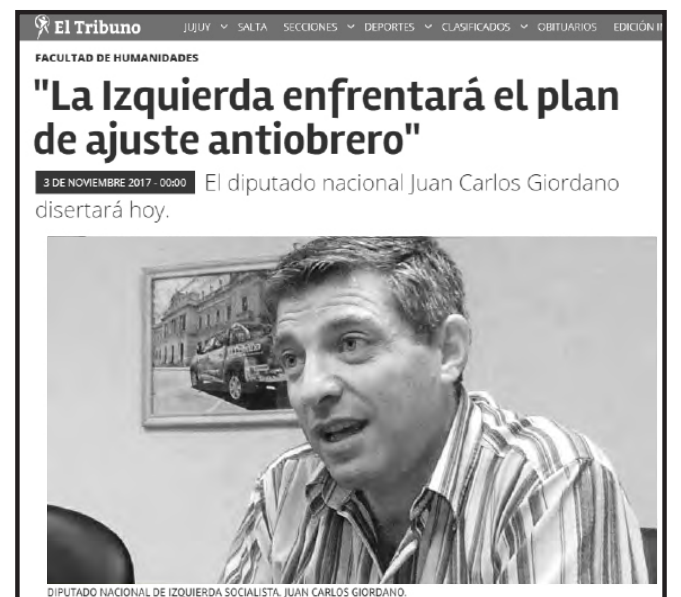
Facsimil de página del diario El Tribuno (Jujuy) con la entrevista