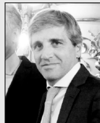
El ministro Caputo involucrado en escandalosos casos de lavado de dinero