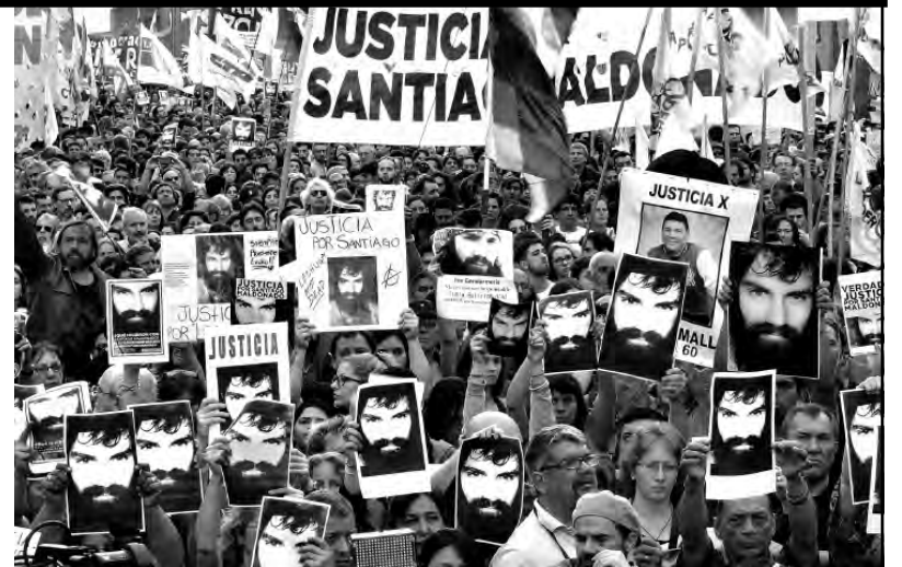
Todas las marchas por Santiago Maldonado fueron multitudinarias

Mientras se sigue con los intentos de negar cualquier responsabilidad en la muerte de Santiago a la Gendarmería, a la ministra Bullrich, al secretario Noceti y a todos aquellos que avalaron el accionar represivo, la familia distribuyó un breve texto en donde